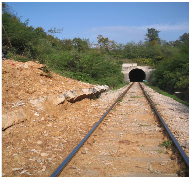
Slika. 1. Pozicija klizišta Figure. 1. Position landslides

Teren na kome se nalazi klizište morfološki je jako razvijen i pripada planinskom dijelu terena područja Čelovnik. Padine su strme sa nagibom 15 - 30^{\circ} , što je odraz geološke građe u podlozi. Na jednoj takvoj padini u dijelu kosine usjeka pruge, na lijevoj strani iz pravca Tuzle, oko 50,0 m prije ulaska u tunel nalazi se razmatrano klizište, sl. 1.