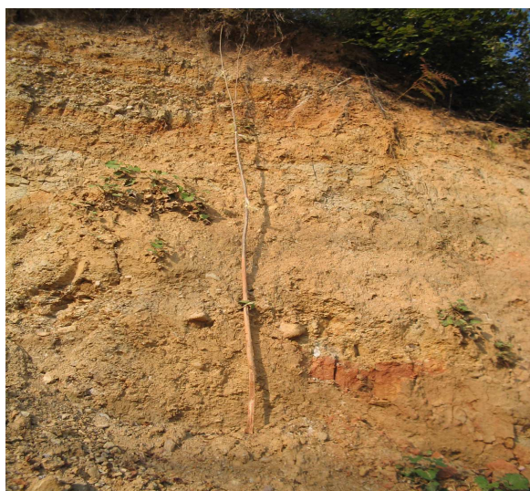
Slika 3. Kompleks grubo klastičnih sedimenata Figure 3. Complex klastičnih coarse sediments