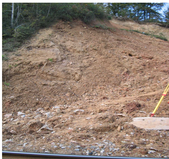
Slika 2. Degradirani dio glinenih škriljaca Figure 2. Degraded part of clay, shale

U gornjem horizontu preovladavaju šljunci veoma heterogeni po veličini valutica, najčešće do 0,3 m. Do dubine 5,0 m pojavljuje se šljunak, pijesak i glina u haotičnoj izmjeni u kojima su mjestimično prisutni odlomci laporovite stijene. Valutice šljunka su veličine i preko 0,2 m, srednje zaobljene. Zrna pijeska su veoma oštra, a na dubini 4,5 m su slabo vezana, crvenkaste boje, sl. 3. Spadaju u grupu slabo do dobrovodopropusnih stijena zavisno od prisustva glinovite komponente.